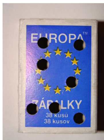
Obr.2: Dierkovačom perforovaná krabička zabezpečuje, aby vzorka neporástla plesňami. Pred predierkovaním vrchnáka vyberte vysúvaciu časť, aby ostala neporušená.

Ak je vzorka príliš vlhká, je možné ju nechať v otvorenej škatuľke čiastočne presušiť pri izbovej teplote počas 12-24 hodín. Vzorky nesušte na radiátore !!!! Pri balení vzoriek pred odoslaním používajte len priedušné materiály (papier, papierové krabice). Nevkladajte vzorky do igelitových vreciek a obalov , nakoľko takto zabalené vzorky plesnivejú a skresľujú výsledky získané z Vašich vzoriek !!! Vzorky balené do nepriedušných igelitových obalov nebudú vyšetrené.