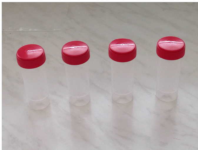
Obr 3: Vzorkovnice.

Zmesné vzorky po odbere odovzdajú chovatelia na regionálnej veterinárnej a potravinovej správe. Táto zabezpečí vypísanie sprievodného dokladu a odošle vzorky do národného referenčného laboratória v Dolnom Kubíne alebo veterinárnych a potravinových ústavov Bratislava a Košice.