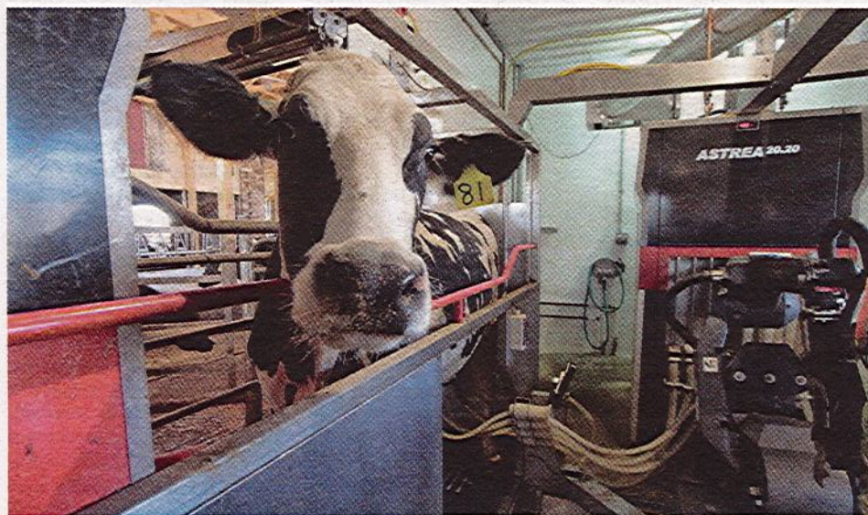
Motiváciou pre návštevu dojaceho robota je aj koncentrát podávaný pri dojení.