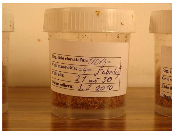
Obr 4: Detail označenia vzorky.

Zmesné vzorky meliva uvedení chovatelia odoberajú a zasielajú na vyšetrenie od 15. januára 2011 do 28. februára 2011.