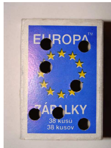
Obr.2: Dierkovačom perforovaná krabička zabezpečuje, aby vzorka neporástla plesňami. Pred predierkovaním vrchnáka vyberte vysúvaciu časť, aby ostala neporušená.

Ak je vzorka príliš vlhká, je možné ju nechať v otvorenej škatuľke čiastočne presušiť pri izbovej teplote počas 12-24 hodín. Vzorky nesušte na radiatore !!!! Pri balení vzoriek pred odoslaním používajte len priedušné materiály (papier, papierové krabice). Nevkladajte vzorky do igelitových vreciek a obalov , nakoľko takto zabalené vzorky plesnivejú a skresľujú výsledky získané z Vašich vzoriek !!! Vzorky balené do nepriedušných igelitových obalov nebudú vyšetrené.