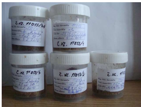
Obr 3: Správne označené vzorky.

Zmesnú vzorku vytvorí chovateľ odobratím rovnej polievkovej lyžice meliva (cca 1,5 až 2 g) z podložky každého úľa, pričom do jednej zmesnej vzorky uvedeným spôsobom odoberie melivo maximálne z 10 úľov (ich čísla uvedie na vzorke obr.3 a obr.4).